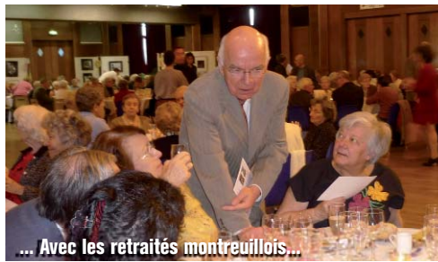
... Avec les retraités montreuillois...