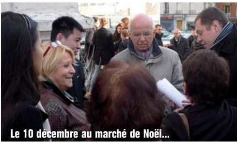
Le 10 décembre au marché de Noël...