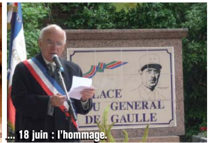
... 18 juin : l'hommage.